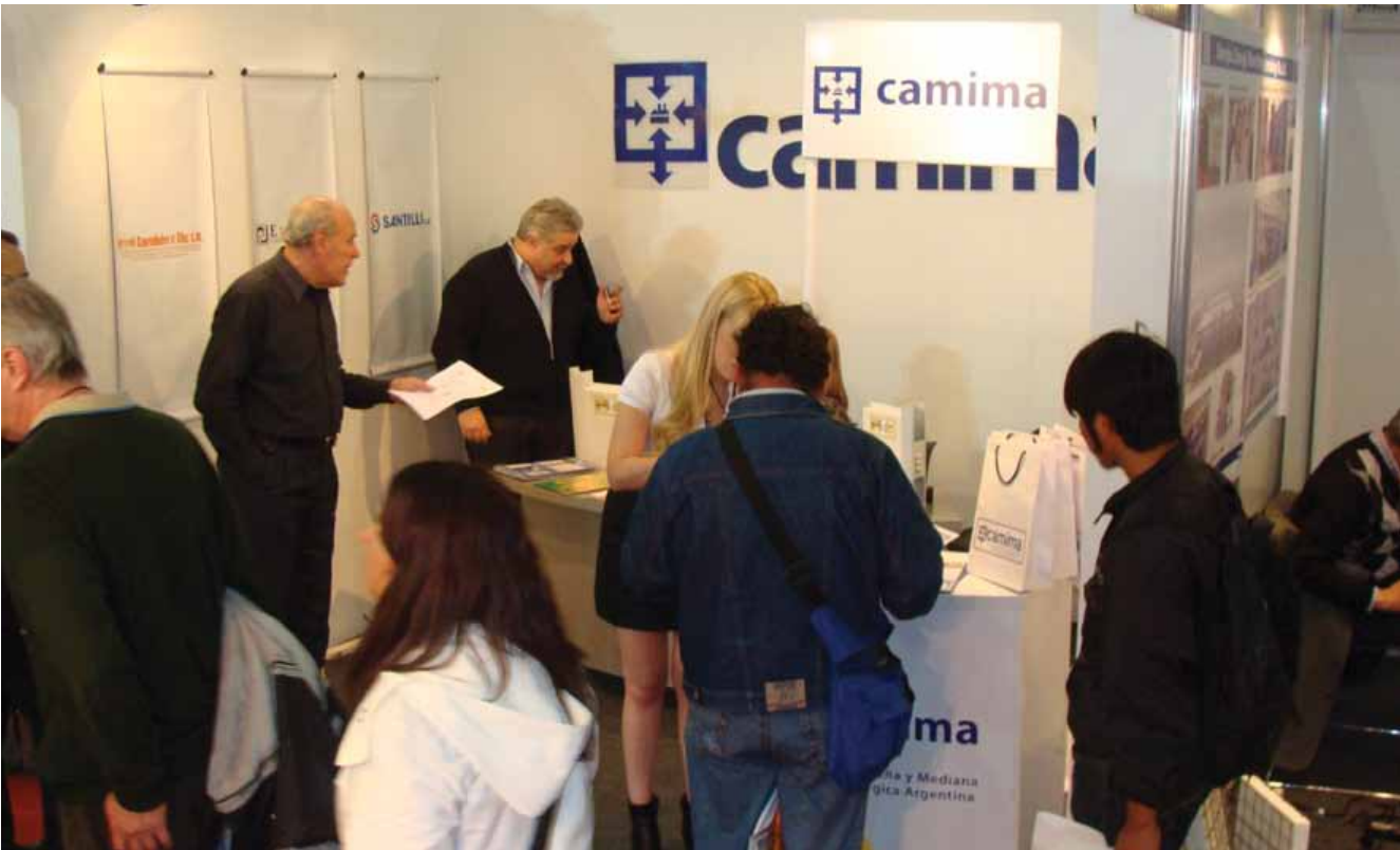
Camima en BATIMAT Expovivienda 2011

ma acercó al Parque la inquietud de empresas que requerían apoyo para el desarrollo de proyectos de base tecnológica.