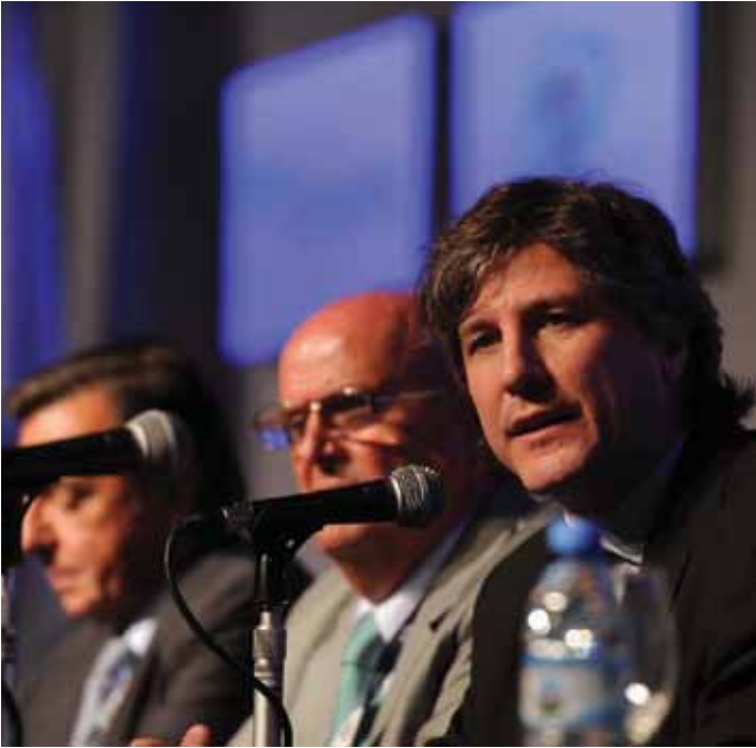
17ª Conferencia Industrial UIA