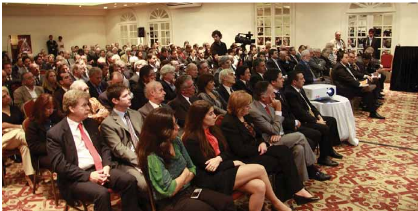
Presentación del Plan Estratégico Industrial Argentina 2020

cilaciones el desarrollo de la industria nacional, fuente de trabajo genuino.