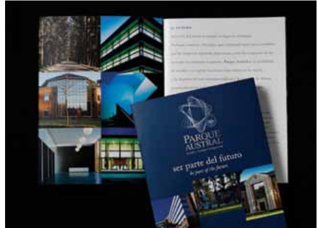
Convenio con Parque Austral

evolucionado de manera de mantener e incluso aumentar en alguna medida el poder adquisitivo real, era imposible realizar concesiones que significaran un incremento por encima del nivel de precios. Camima recordó que siendo en general las Pymes empresas con fuerte contenido de mano de obra en sus procesos, se veían especialmente afectadas por los aumentos en el valor de la mano de obra. Además se recordó el riesgo de que aumentos nominales de salarios por encima de ciertos valores puede terminar realimentando el proceso de suba de precios y diluyendo las ventajas obtenidas. Algún intento por parte de las autoridades del Ministerio de acercar posiciones fracasó por lo que, ante la posibilidad anunciada de medidas de fuerza por parte de la Uom, dictó la conciliación obligatoria y luego una prórroga de la misma.